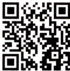
ลงทะเบียนส่งผลงาน

(ส่งผลงานนวัตกรรมสายอุดมศึกษา ประจำปี ๒๕๖๗ (Higher Education Innovation Awards 2024))