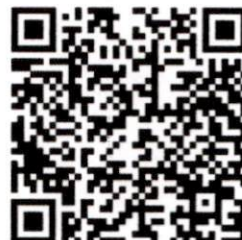
เอกสารประชาสัมพันธ์